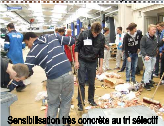
Sensibilisation très concrète au tri sélectif