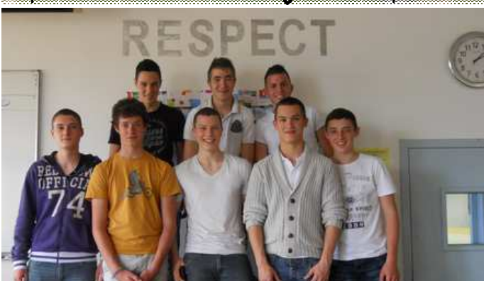
Les 2 PTA ont usiné les lettres du mot et les ont posées en étude