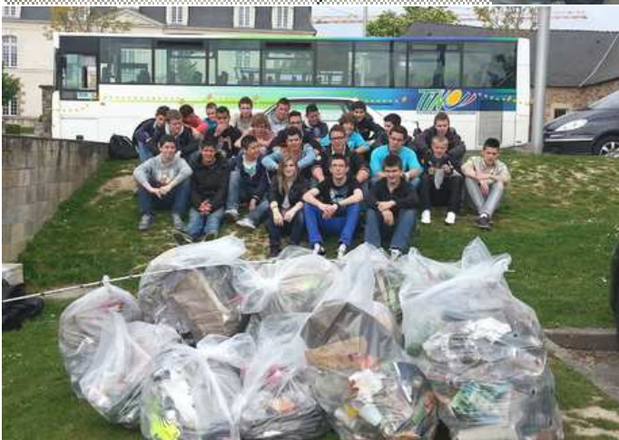
Respect de l'environnement : ramassage de déchets par les 2GTA