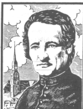
Jean-Marie de La Mennais et l'enseignement technique

Usé par les travaux, les épreuves, la maladie, conséquence de ses voyages, J-Marie de la Mennais meurt le 26 décembre 1860.