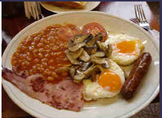
Le breakfast proposé par l'hôtel