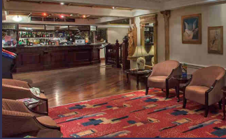
Bar-salon de l'hôtel