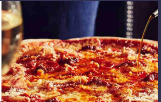
La pizza du restaurant Express Pizzeria