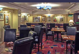
Le restaurant de l'hôtel