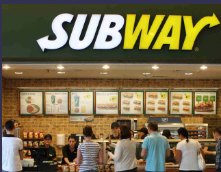
Le Subway proche de l'Autosport